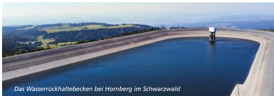
Das Wasserrückhaltebecken bei Hornberg im Schwarzwald