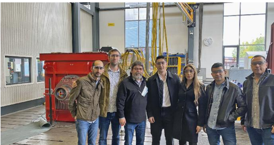
Unsere kolumbianischen Kunden bei der Abnahme ihrer Generatoren in WKV-Prüffeld.

Mit im Besuchertrupp aus Kolumbien war auch ein potentieller Neukunde, dessen Firma aktuell die Finanzierung für ein Wasserkraftprojekt via „crowdfunding“ aufbringt. Sobald die erforderliche Mindestsumme erreicht ist, wird das Projekt gestartet. Das Konzept unterscheidet sich auch darin, dass der Kunde den Strom nicht in das öffentliche Netz einspeist, sondern die Stromabnehmer selbst sucht. Somit kann er seine Strompreise selbst verhandeln und ist unabhängig vom öffentlichen Netz. Der Kunde ist mit diesem Konzept sehr erfolgreich und hat schon einige Hotels realisiert. Nun möchte er in den Energiesektor und vor allem in die Wasserkraft einsteigen. Die Finanzierung ist aktuell bei knapp 50 Prozent und ein Stromabnehmer ist auch schon gefunden. ▶