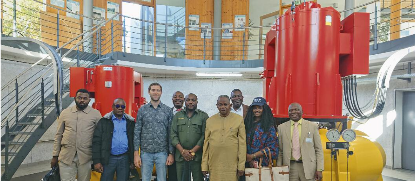
Ein zufriedener Energieminister aus Afrika mit seiner Delegation vor unserer Firmen-Wasserkraftanlage.

Das Pandemiejahr 2020 legte die Welt still und auch WKV konnte nur wenig Besuch persönlich empfangen. Virtuelle Meetings sind zwar schön und gut, aber es geht nichts über eine persönliche Besprechung und eine Besichtigung unserer Firma, die bisher noch jeden Kunden von uns überzeugt hat. Daher haben wir uns sehr gefreut, dass wir in diesem Jahr gleich mehrere wichtige Besucher empfangen konnten und damit einige grundlegende Bausteine für volle Auftragsbücher in der Zukunft gelegt haben.